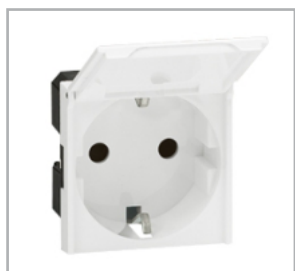
1-vägsuttag med lock