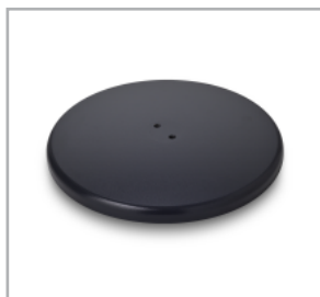
Tung fot i antracitgrå (RAL7016).