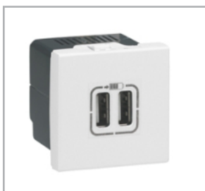
2xUSB (för laddning, 2,4A)