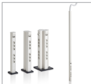
Finns även som stubbe och väggmonterad stav.