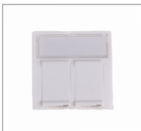
Datauttag (2xRJ45 Keystone)