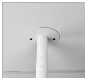
Slang med rund takgenomföring.