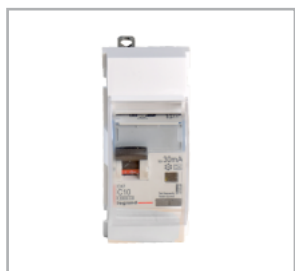
Jordfelsbrytare 2P 25A 30mA