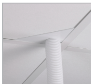
Slang med trekantig takgenomföring, för hörn.