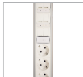
Uttag/nätverk är uppmärkta på stav och kablage för enkel installation.