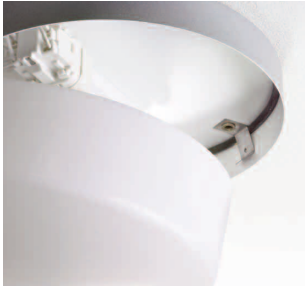
Gummipackning tätar mellan stomme och kupa.