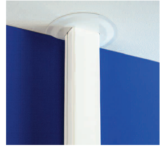
Takanslutning vägg R Takanslutning intill en vägg som ger en dekorativ anslutning mot tak och döljer takgenomgången. Finns i vitt.