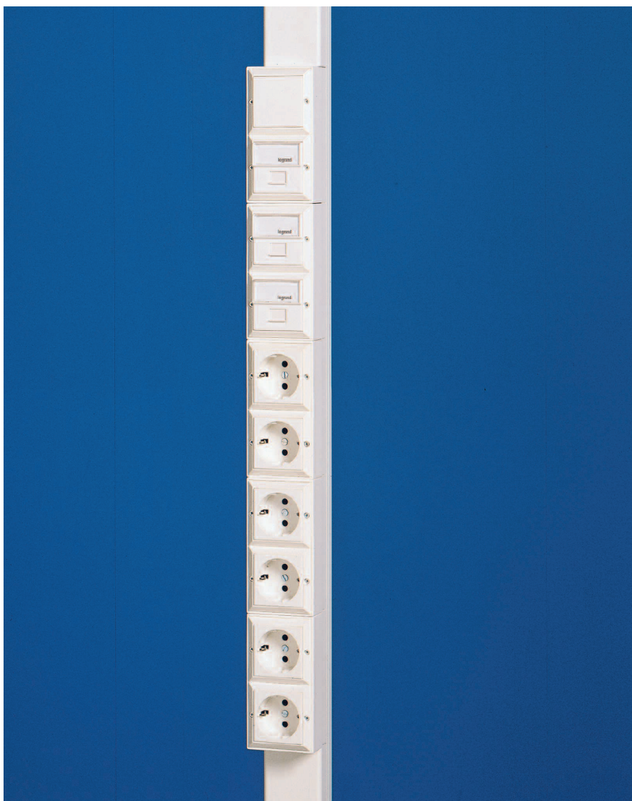
R-stav väggmonterad för en arbetsplats

ONY R-stav är en flexibel rektangulär uttagsstav för en arbetsplats. Enheten kan bestyckas med allt som behövs vid en arbetsplats – starkströmsuttag, anslutning till datanätverk, telefonuttag, rörelsedetektorer och dimmers. Finns i vitt.