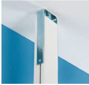
Takfäste fast RO Fast takfäste för montage av fristående stav. Galvaniserat utförande.