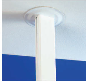
Takanslutning R Takanslutning som ger en dekorativ anslutning mot taket och döljer takgenomgången. Finns i vitt.