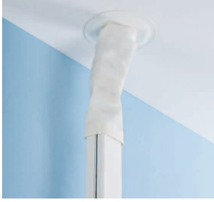
Flexibel takanslutning för fristående stav, vit textil längd 1000 eller 3000 mm.