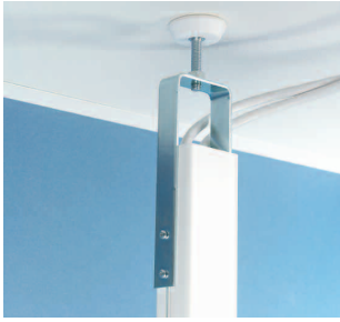
Takfäste justerbart RO Justerbart takfäste för montage av fristående stav. Max stavförlängning 500 mm. Galvaniserat utförande.