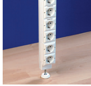
Golvfäste justerbart RO Justerbart golvfäste för stavar där man inte vill göra märke i golvet. Detta montage kräver infästning i bjälklaget med takfäste.