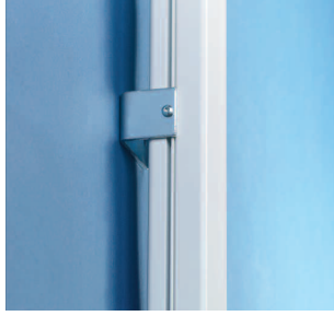
Väggfäste RO Väggfästet är justerbart i höjddled längs staven. Galvaniserat utförande.