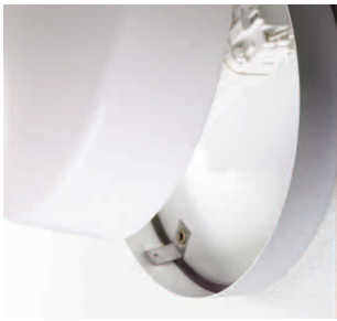
Gummipackning tätar mellan stomme och kupa.